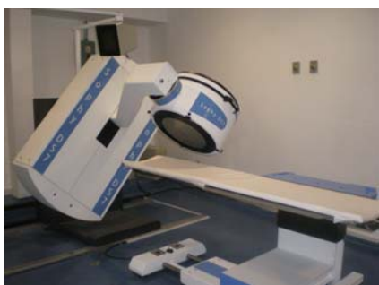
GAMMACAMARA SPECT- GATED LMP. AV. CUAUHTEMOC N°379