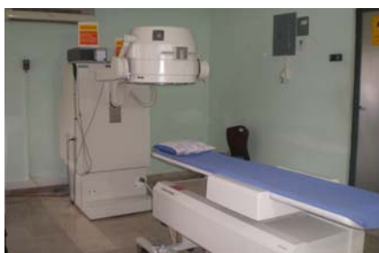
GAMMACAMARA SPECT- GATED IMN. RIOBAMBA N° 758-12