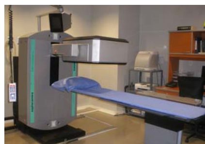
GAMMACAMARA SPECT - GATED CHS. CTO. MISIONEROS N° 5